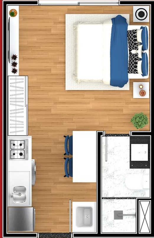
PLANTA STUDIO. 22 m 2