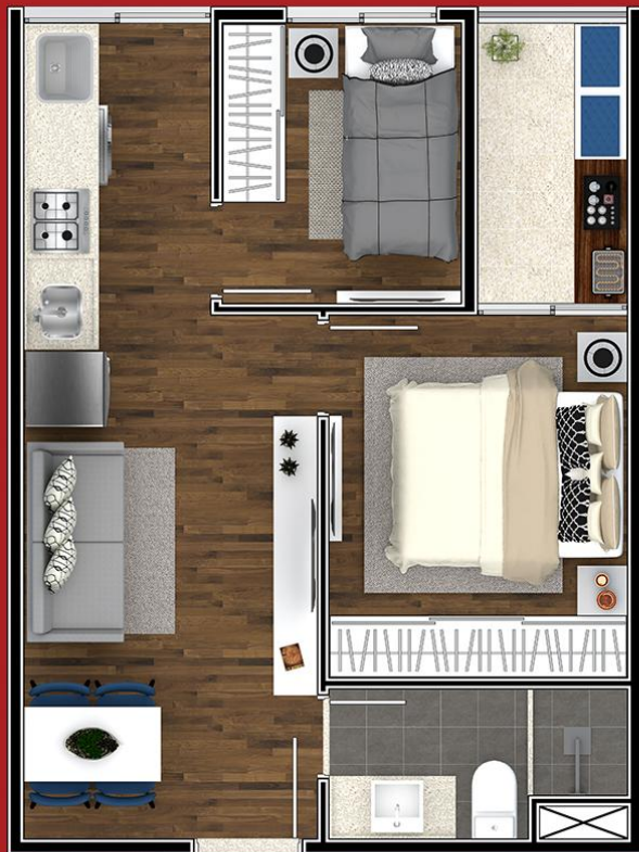
PLANTA 2 DORMS. 34 m 2