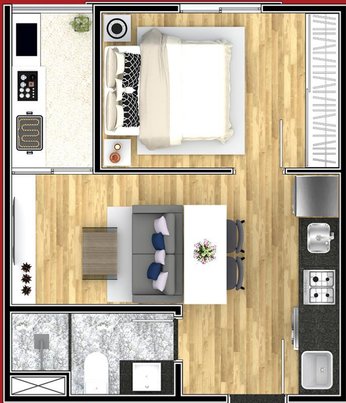
PLANTA 1 DORM. 30 m 2