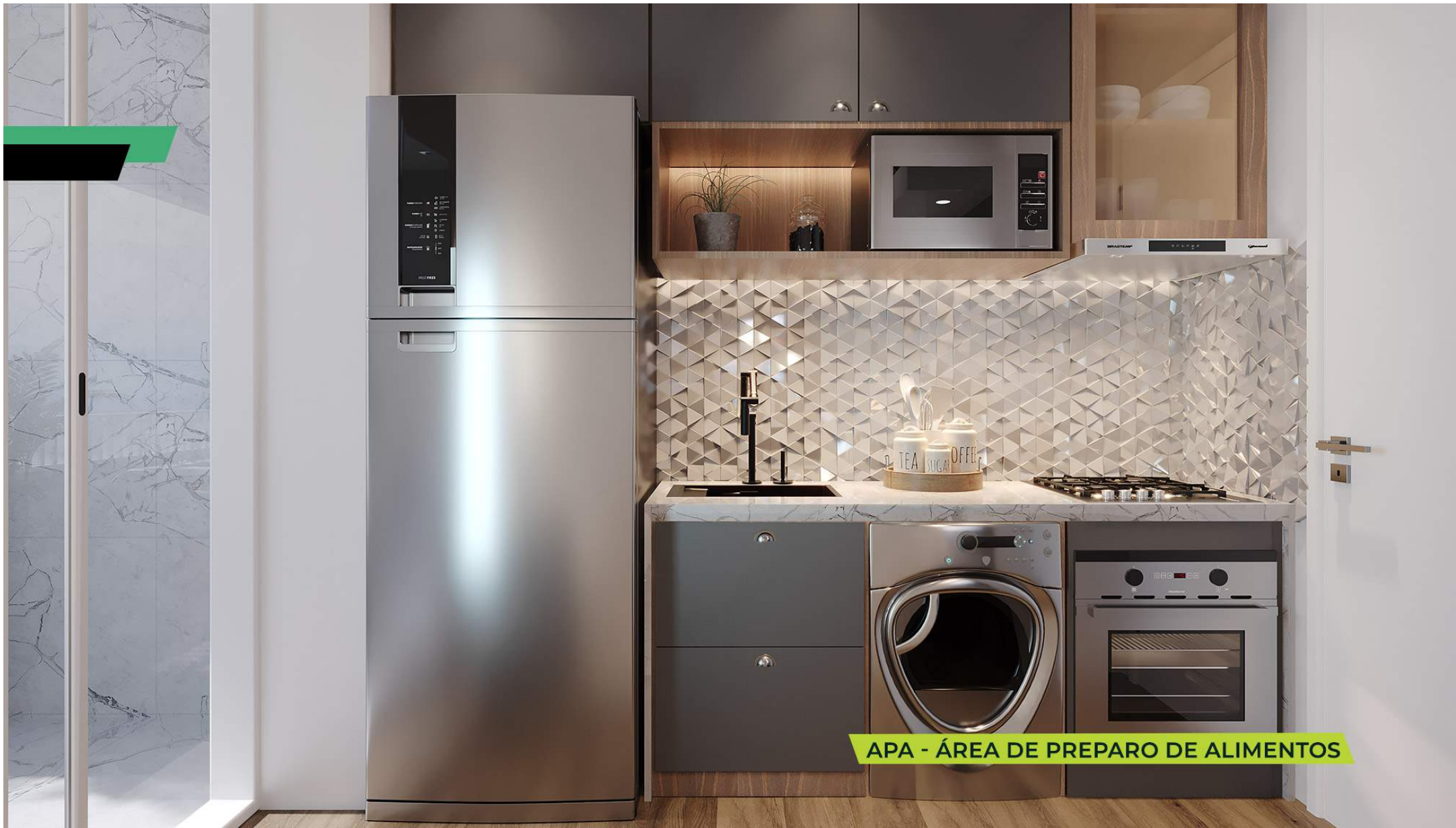
APA - ÁREA DE PREPARO DE ALIMENTOS