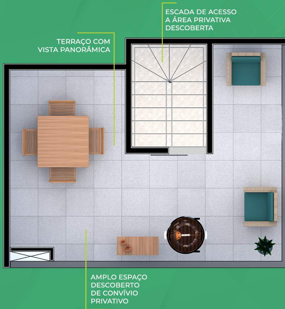
Ilustração artística da planta com sugestão de decoração. Os móveis, utensílios, adornos e equipamentos não fazem parte do contrato de venda e compra. Acabamentos e revestimentos serão entregues conforme memorial descritivo específico. Esta planta poderá sofrer variações decorrentes do atendimento de postura de órgãos públicos e concessionárias.