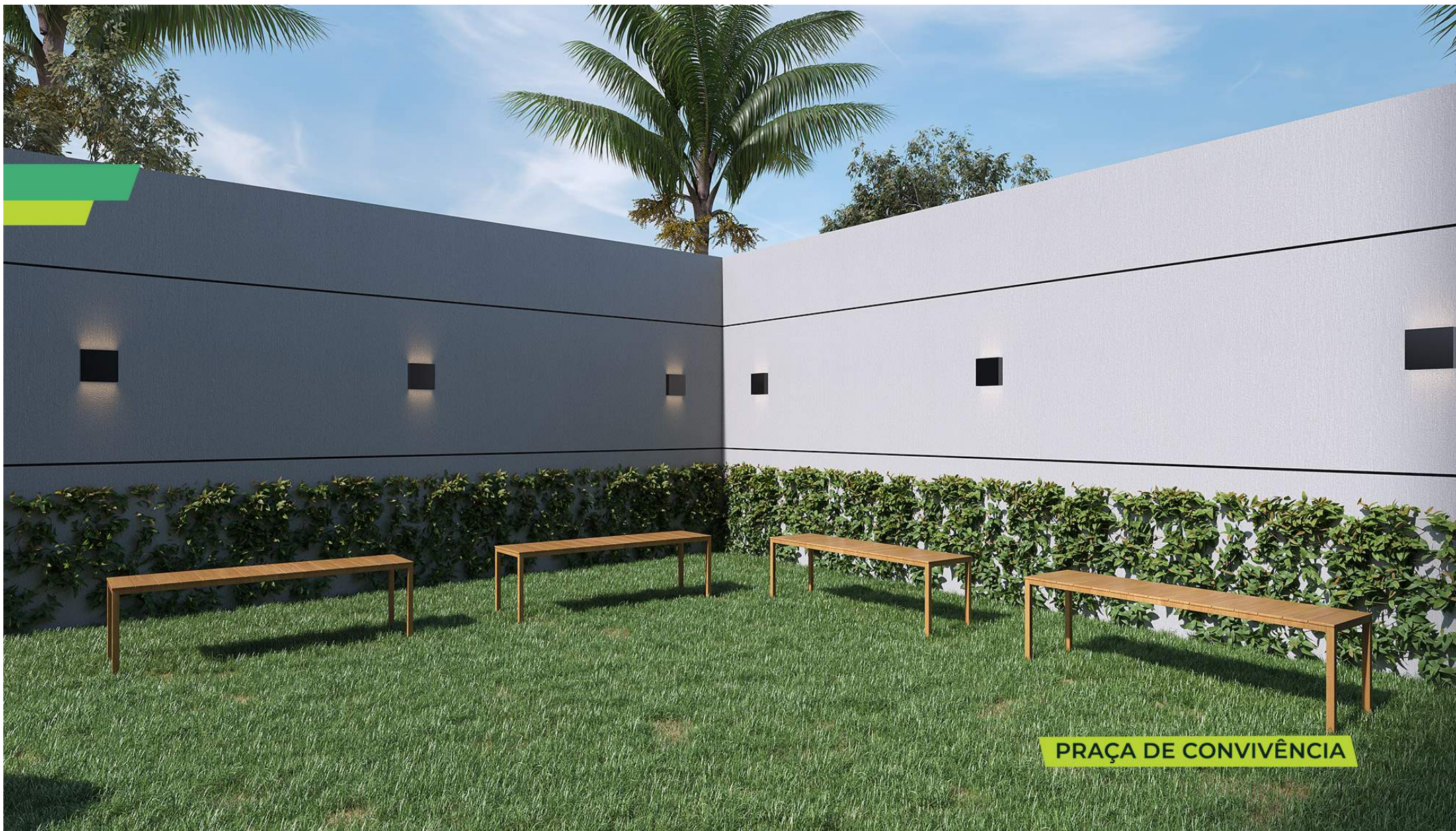
PRAÇA DE CONVIVÊNCIA