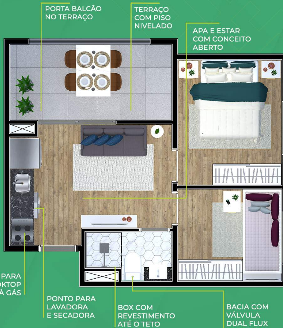
Ilustração artística da planta com sugestão de decoração. Os móveis, utensílios, adornos e equipamentos não fazem parte do contrato de venda e compra. Acabamentos e revestimentos serão entregues conforme memorial descritivo específico. Esta planta poderá sofrer variações decorrentes do atendimento de postura de órgãos públicos e concessionárias.