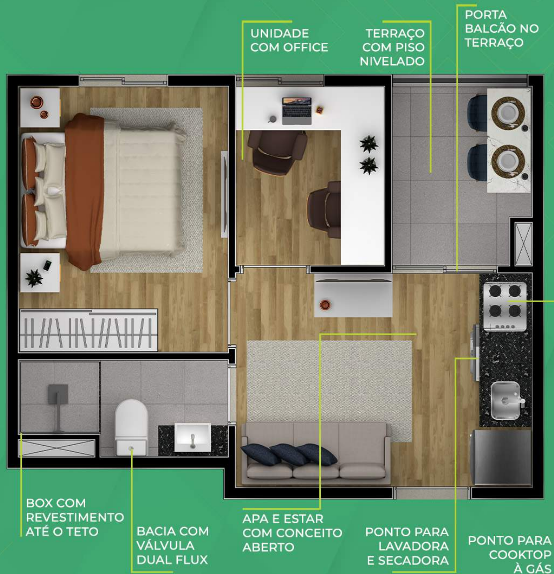
Ilustração artística da planta com sugestão de decoração. Os móveis, utensílios, adornos e equipamentos não fazem parte do contrato de venda e compra. Acabamentos e revestimentos serão entregues conforme memorial descritivo específico. Esta planta poderá sofrer variações decorrentes do atendimento de postura de órgãos públicos e concessionárias.